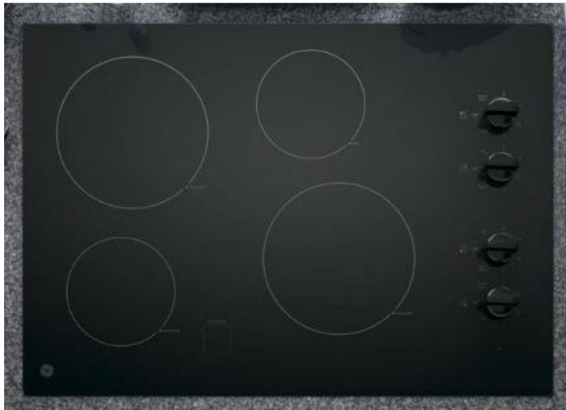
Concernée par le rappel : table de cuisson GE à éléments radiants, numéro de modèle JP3030DJ4BB.