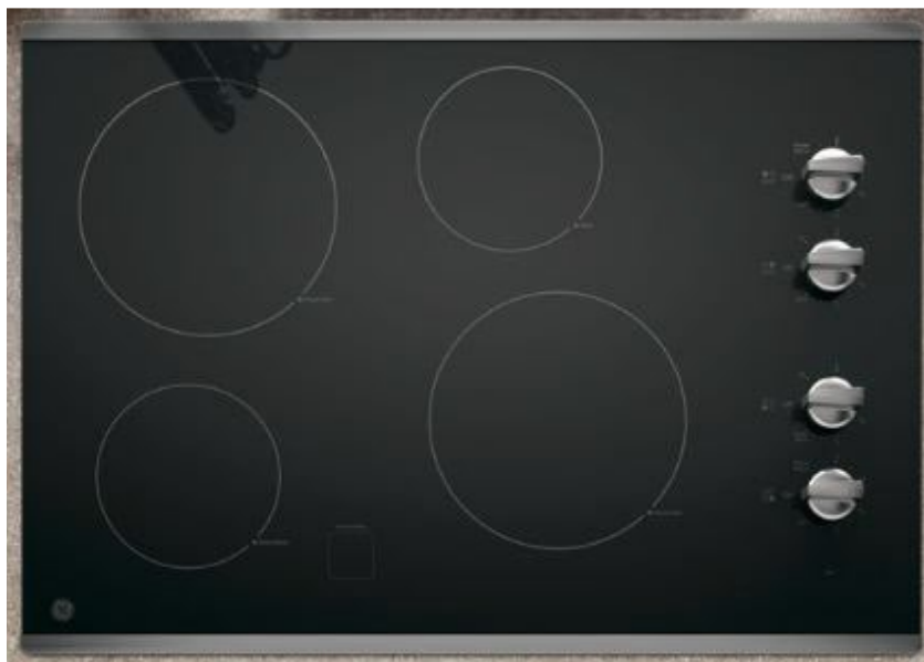
Concernée par le rappel : table de cuisson GE à éléments radiants, numéro de modèle JP3030SJ4SS.